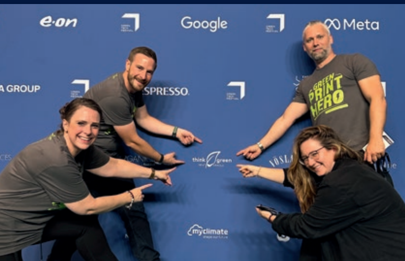
TEAM green – ARNOLD group als Partner auf dem GREENTECH FESTIVAL 2023