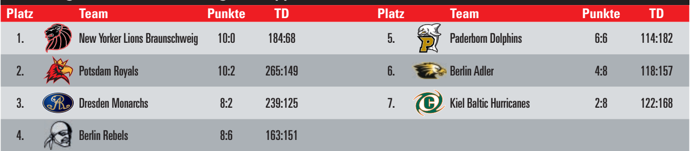
Tabelle Liga German Football League: Gruppe Nord